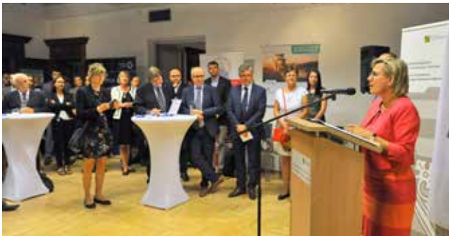
Minister Zdrowia Saksonii, Barbara Klepsch, otworzyła 2. Saksońsko-Polski Dzień Innowacji

strzeżenia dot. biomedycyny i technologii medycznych, firmy dyskutowały przede wszystkim o konkretnym wdrażaniu innowacyjnych technologii, jak druk 3D. Wyzwania medyczne, naukowe i przemysłowe w zakresie rozwoju nowych implantów, ich materiałów i wprowadzenia na rynek stanowiły główny punkt dyskusji. Ponadto eksperci z dziedziny transferu wiedzy i technologii zaprezentowali możliwości kooperacji oraz zdemonstrowali najlepsze przykłady udanej współpracy ośrodków badawczych różnych dyscyplin.