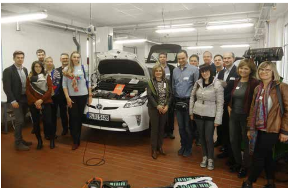
Partnerzy z siedmiu krajów na spotkaniu w Kfz-Innung Berlin

W ramach pierwszych warsztatów transnarodowych, które odbyły się w dniach 22-24 października 2018 r. w Berlinie, przedstawiciele strategicznych partnerstw dyskutowali o treściach i metodach nauczania, które przekazywałyby nowe technologie oraz o współpracy między zawodowym i akademickim kształceniem. Przy czym priorytetem był ciągły główny cel, a mianowicie ustalenie etapów projektu, by