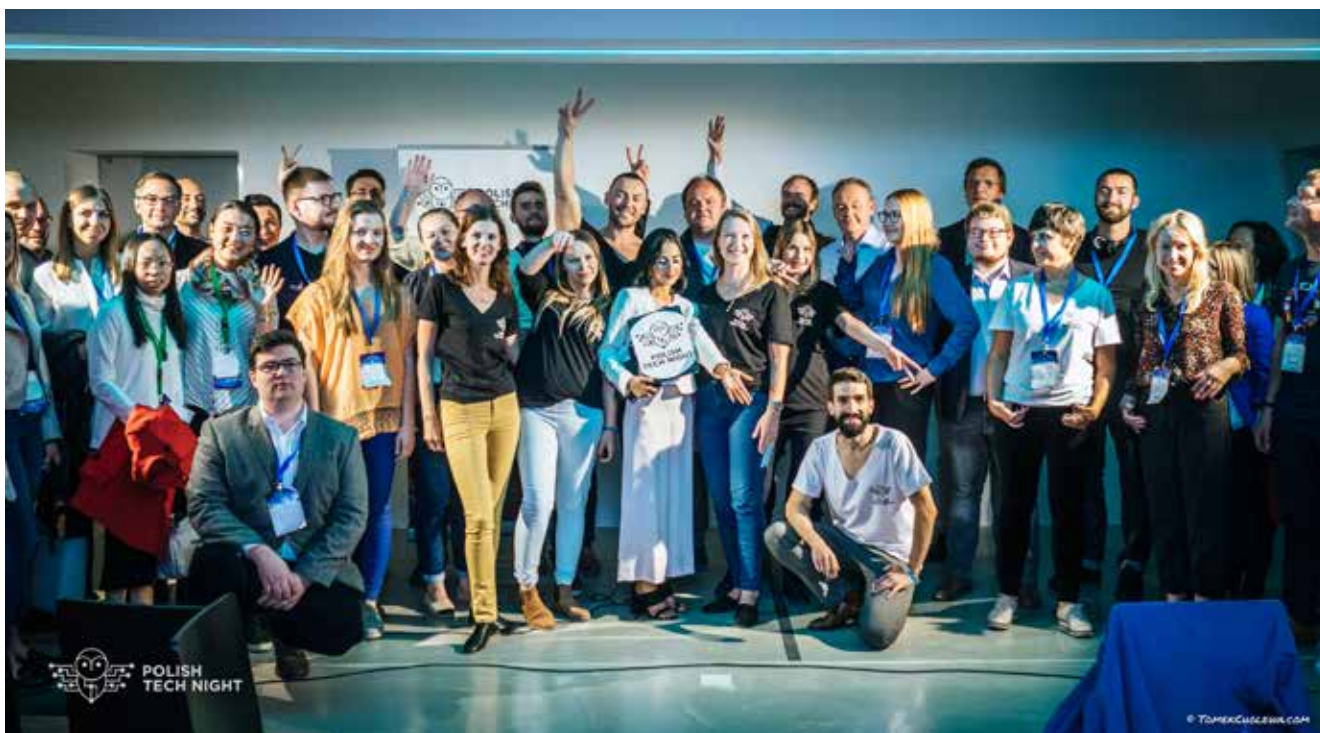
Uczestnicy IV edycji Polish Tech Night

Polish Tech Night jest częścią projektu „LOOKOUT”, który został przeprowadzony przez SIBB e.V. i jest współfinansowany przez Administrację Senacką ds. Gospodarki, Energii i Zakładów Miejskich.