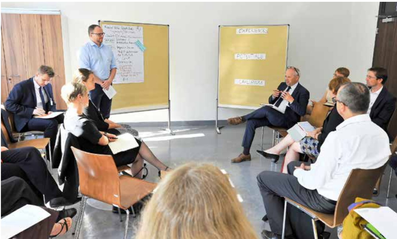
Uczestnicy 2. Saksońsko-Polskiego Dnia Innowacji podczas warsztatów dotyczących doświadczeń, potencjałów i przeszkód w spersonalizowanej medycynie i technologiach medycznych

Na stronie internetowej https://xborderinnovation.eu można znaleźć dalsze interesujące informacje o Dniach Innowacji we Wrocławiu.