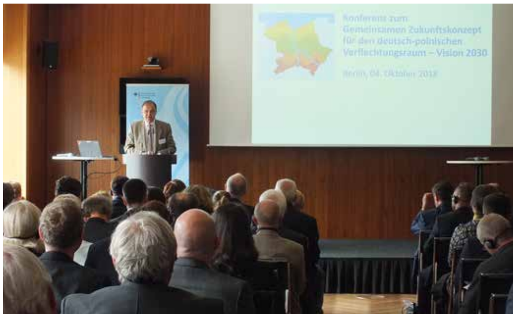
Konferencja Wspólnej Koncepcji Przyszłości łączy podmioty z polsko-niemieckiego obszaru.

Odry. Mowa tu o miejscach pracy oraz synergii pomiędzy ośrodkami gospodarczymi i badawczymi a przestrzenią życiową atrakcyjną szczególnie dla młodych rodzin. Koncepcja ukazuje, co wspólnie można uczynić z regionu zamieszkałego przez 21 milionów mieszkańców.