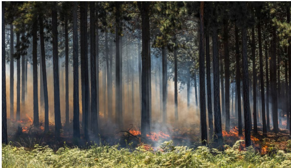
W ubiegłym roku w Polsce doszło wielokrotnie do pożarów na skutek nielegalnego składowania odpadów.

Kraj Związkowy Brandenburgię oraz Polskę łączy wspólna granica wewnętrzna o długości 235 kilometrów z intensywnym przepływem towarów. Również transporty z odpadami przekraczają codziennie granicę – głównie w kierunku Polski. Według doniesień prasowych w 2018 r. Polska osiągnęła najwyższy poziom importu śmieci. Dane Głównego Inspektoratu Ochrony Środowiska w Polsce mówią o 434.00 tonach wwiezionych śmieci z zagranicy. Ponad połowa z nich, bo 250.000 ton, pochodzi z Niemiec. Kontrole transportów z odpadami wykazują ponadto, że śmieci przewożone były przez granicę nielegalnie bez wymaganych zezwoleń odpowiednich urzędów.