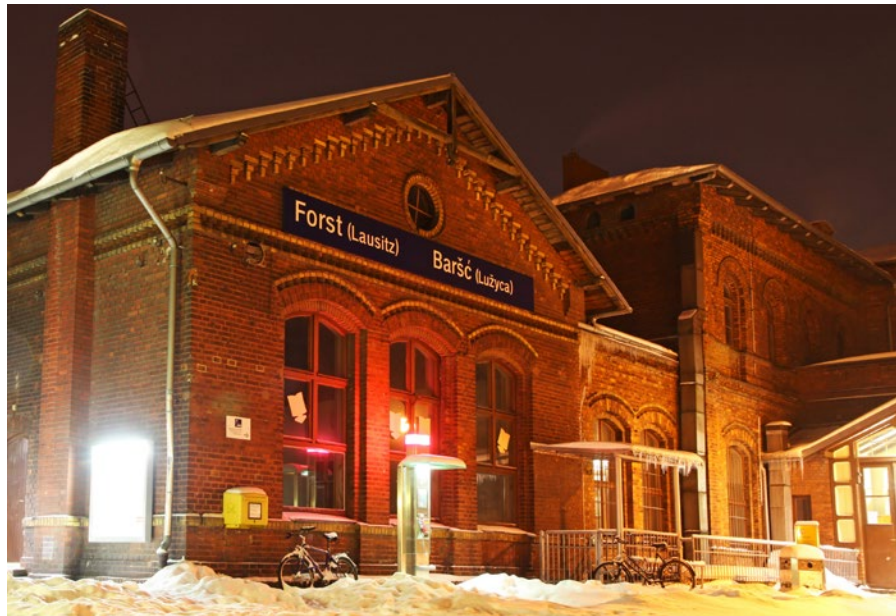
Transgraniczny ruch kolejowy ma duże znaczenie dla regionów Partnerstwa Odry.

We wrześniu po raz 13. rozpoczęły się w Gdańsku TRAKO, Międzynarodowe Targi Kolejowe. TRAKO jest jednym z największych spotkań branży transportu szynowego w Europie. Co dwa lata ściągają one do Polski międzynarodowych wystawców, również w tym roku na targi przybyły tysiące odwiedzających. Targi wraz z ponad 700 wystawcami z 30 krajów zaoferowały odwiedzającym bogaty program. Również Region Odry odgrywa ważną rolę w transgranicznym ruchu kolejowym. Pociąg do Kultury cieszy się wciąż niesłabnącą popularnością jako łącznik między Berlinem i Wrocławiem. Jak ważny jest ruch kolejowy pomiędzy dwoma krajami okazało się również podczas TRAKO – spółka Kompetenznetz Rail Berlin-Brandenburg GmbH (KNRBB) była ponownie na miejscu. Berlin Partner GmbH zorganizował wspólne stoisko dla Berlina i Brandenburgii, w którym wzięło udział także trzech partnerów spółki KNRBB.