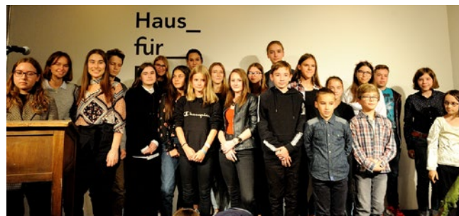
Pisarze kolejnej generacji zaprezentowali się swojej publiczności.

Transgraniczny konkurs literacki dla młodych ludzi mówiących po polsku lub polskich rodzimych użytkowników języka z całej Europy co roku organizowany jest przez stowarzyszenia POLin e.V. Polki w Gospodarce i Kulturze oraz Polskie Towarzystwo Szkolne „Oświata”. Laureaci zostali zaproszeni na weekend do Berlina, gdzie mogli wziąć udział w wielu kreatywnych warsztatach, zwiedzaniu miasta i programie kulturalnym. Wszystkie nagrodzone wiersze zostały wydane w tomiku oraz online.